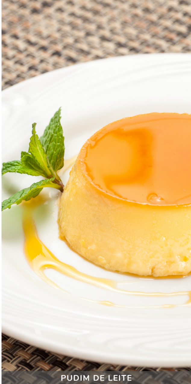
PUDIM DE LEITE