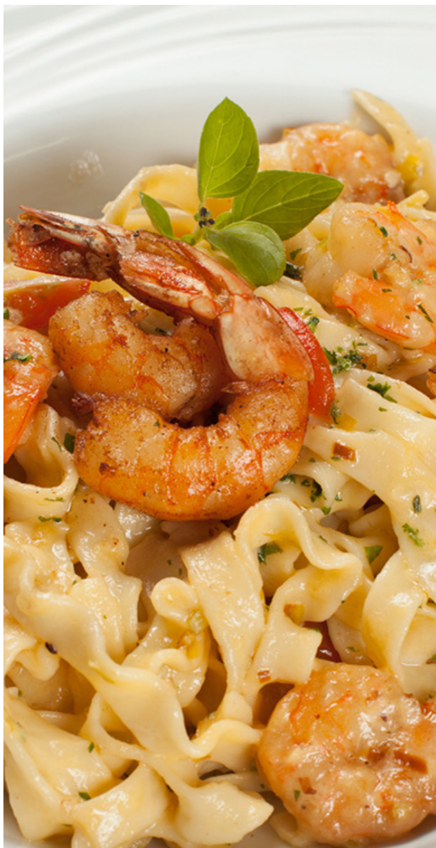
FETTUCCHINE DE CAMARÃO ÀS NATAS