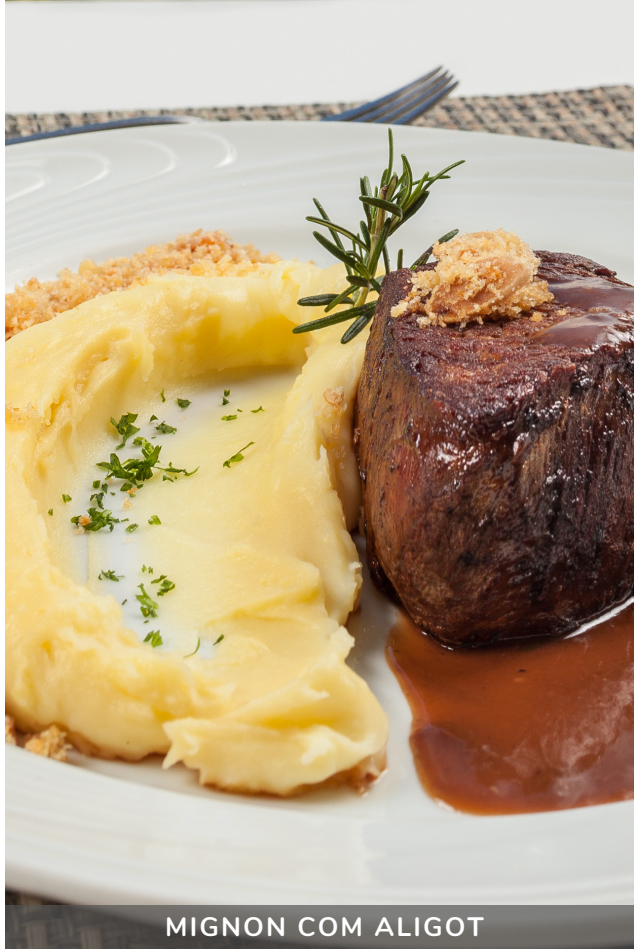
MIGNON COM ALIGOT